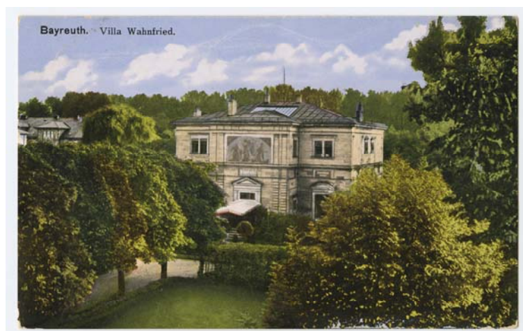
Postkarte Haus Wahnfried, um 1915