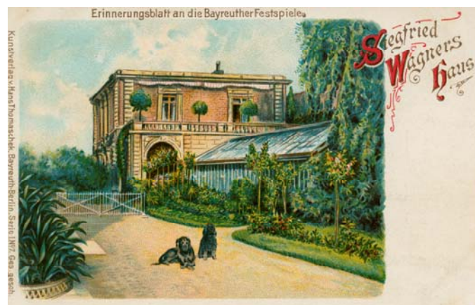
Postkarte Siegfried Wagner-Haus, um 1894