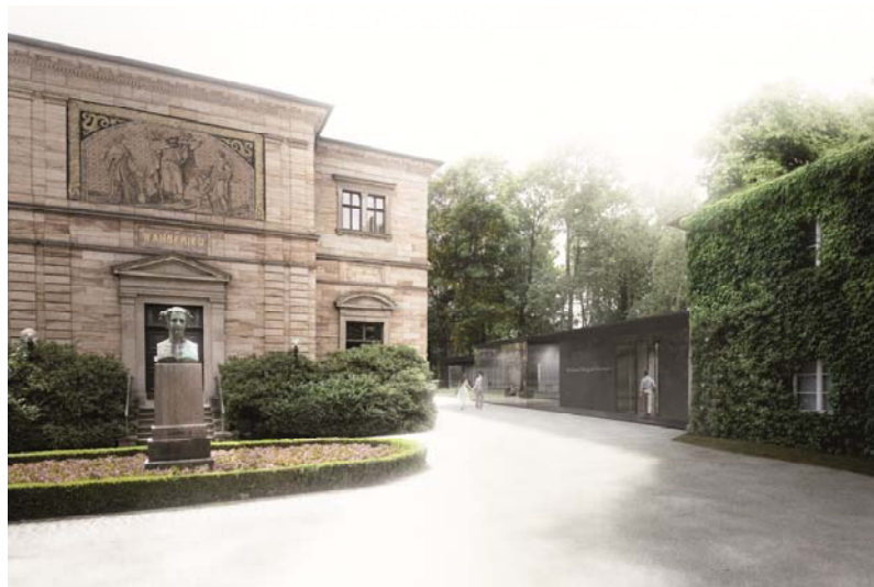
Entwurf Neubau 2013