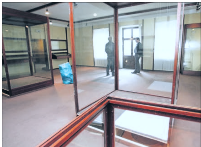
Plant Damien Hirst hier eine Ausstellung mit in Formaldehyd schwimmenden Tierkörpern? Nein, es sind nur verwaiste Kostüm-Vitrinen im Haus Wahnfried.

Drei Honorarkräfte verstärken das Museumsteam gerade, im Sommer sollen sie in befristete Verträge übernommen werden. Die Museumsarbeit geht