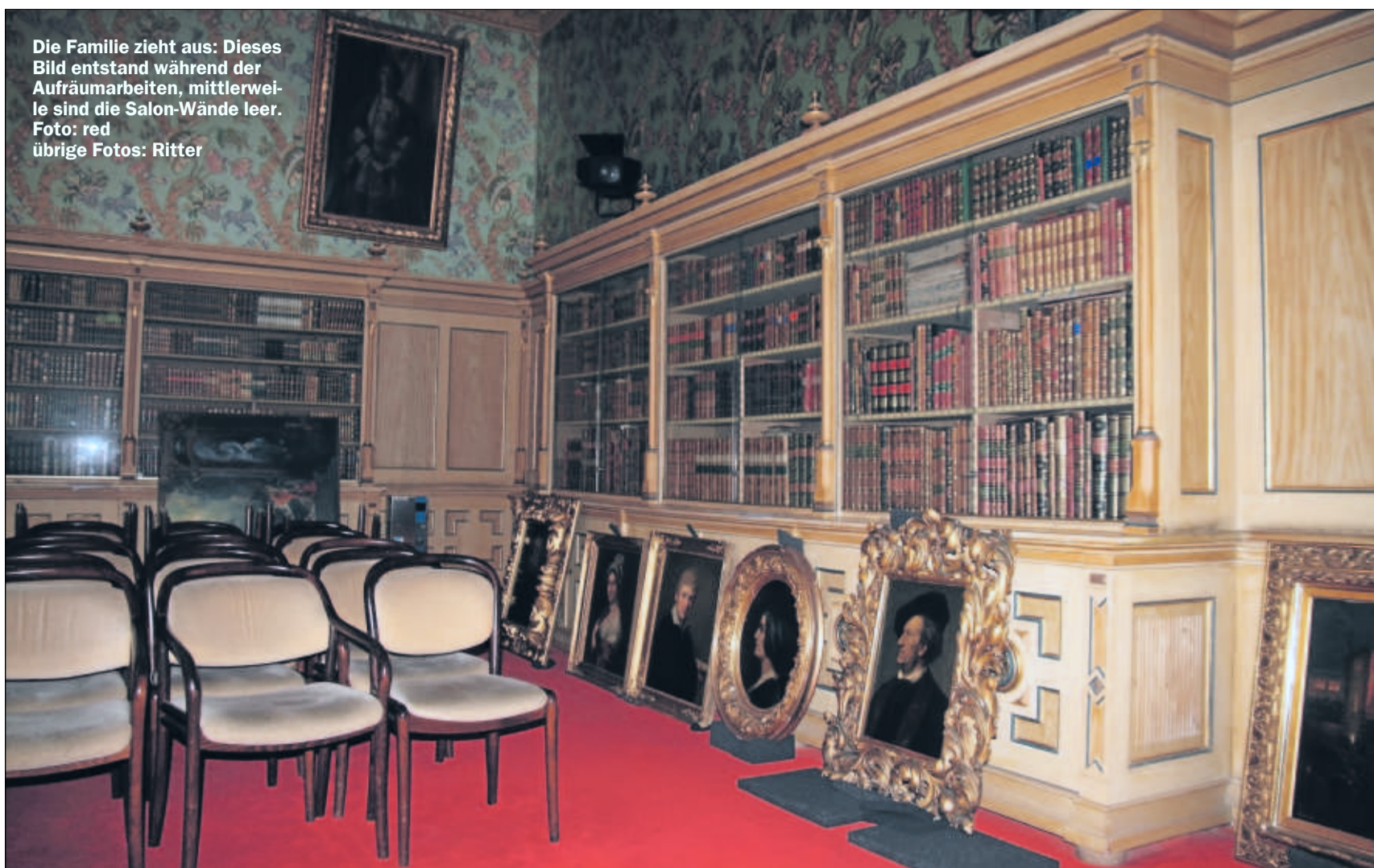
Die Familie zieht aus: Dieses Bild entstand während der Aufräumarbeiten, mittlerweile sind die Salon-Wände leer.