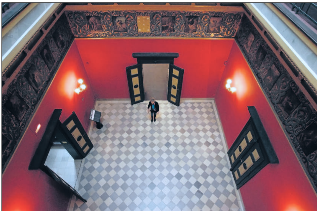
Büsten weg, Klaviere raus – sogar ein Bild aus dem Nibelungen-Fries von Franz Heigl wurde von der Wand genommen. Der Restaurator soll den Zustand überprüfen.